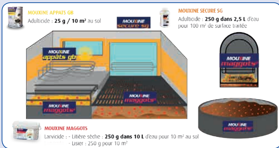
Lieux d'application des différents produits larvicides et adulticides

Réf. : 561141 - Pot 400 g - 23,90€ HT Réf. : 561142 - Pot 2 kg - 99,90€ HT