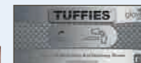
GANTS DE TRAITE NITRILE BLEU TUFFIES

En nitrile bleu très résistant. Antiallergéniques, sans latex. Non poudrés. Poignets longs. Longueur 30 cm. Boîte de 50 gants.