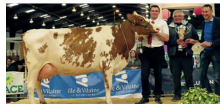
GAVOTTE Meilleure Mamelle Pie Rouge Gaec Pinel - CHEVAIGNÉ