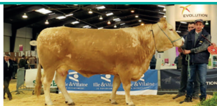
ETOILE Championnat Femelle Blonde d'Aquitaine - Earl Boittin - FLEURIGNÉ

Bravo aux éleveurs qui ont remporté les prix de championnat lors du concours départemental de Rennes.