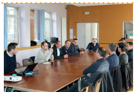
Les éleveurs utilisateurs de la technique Shredlage pour la récolte de maïs 2016 se sont réunis à Tréméheuc.

Contactez Anthony BASLÉ anthony.basle@eilyps.fr 06 88 84 25 48