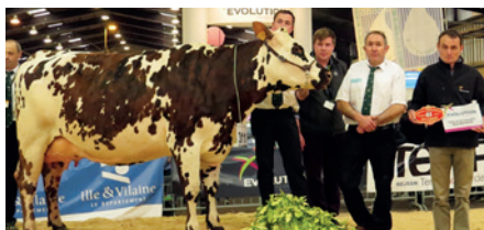
IDEAL STAR Prix de Championnat Normande - Gaec de la Morlais ST-GERMAIN-EN-COGLES