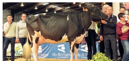
POM HAILEY Grande Championne Prim'Holstein - Earl de la Grande Pommeraiie - IFFENDIC