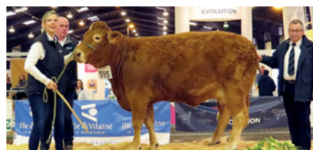
GRENOUILLE Championne Femelle Adulte Limousine - Gaec du Bois au Be TREBRY